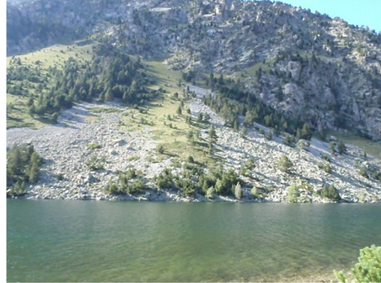
Color y aspecto del agua.