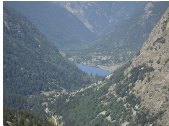
Vista desde el camino al Estany de Delluí.