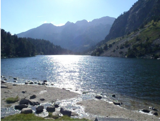
Vista desde el litoral.